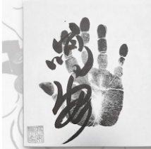
●力士直筆サイン例

開場直後からの力士四名による握手会のあと、力士に直接質問して大相撲の知識を深めていただける質問コーナーや、ご来場の皆様から抽選で20名様に、力士直筆サインや相撲土産が当たる、お楽しみ抽選会も行います。 巡業ならではの楽しい企画が盛りだくさんです。